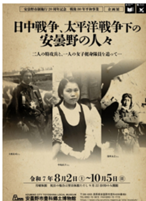
昨年度の豊科郷土博物館の企画展チラシ

臼井 市長 戦争では、人が死に、傷つくだけでなく、安曇野でも人々が若者を戦場に送り出し、天皇の国のために命を捨てて戦う若者を育て、「戦争に勝つため」が暮らしの隅々に浸透し、それに逆らうことは許されず、我慢することが当たり前だった。このように、戦場でなくても安曇野の人々は戦争をしていた。こうした認識の上で、今後の平和推進事業をやってもらいたい。